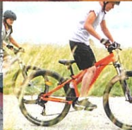
VTT - Vélos électriques